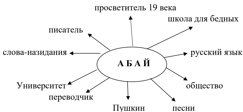
Ассоциативдик схема 1.3.3.

Көрсөтүлгөн сөздөрдүн тизмеги аркылуу импровизациялык текст түзөбүз, ал жаңы тексти кабыл алууга зарыл маалыматтарды камтыйт. Мисалы, Абай – великий казахский писатель 19 века. Он является одним из первых писателей-просветителей, автором многих произведений стихотворений. Он родился в обеспеченной семье. Много читал, интересовался творчеством писателей-классиков русской и зарубежной литературы: Пушкиным, Лермонтовым, Достоевским. Занимался переводческой деятельностью. Перевел на казахский язык фрагменты романа в стихах Пушкина «Евгений Онегин».